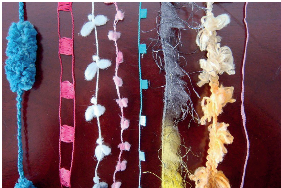
Rysunek 1. Przykład współcześnie produkowanych nitek fantasyjnych

Nitki fantasyjne przypominają biżuterię, której nigdy nie należy nadużywać. Uroda nitek fantasyjnych jest tym większa, im bardziej delikatną strukturą się one charakteryzują. Cienkie nitki fantasyjne z lekko zmieniającymi się elementami kolorystycznymi zachwycają urodą. Producenci tego typu tkanin i dzianin nie podzielają zachwyty z racji licznych problemów napotykanym w procesie przetwórczym. Im bardziej złożoną i jednocześnie cienką strukturą charakteryzuje się nitka fantasyjna, im bardziej drogi i cienki surowiec wykorzystano do jej wytworzenia, tym wymaga większego nakładu pracy już na etapie przedzenia czy skręcania. Generuje to również wyższą cenę nawoju nitki fantasyjnej. Wykreowanie nitek fantasyjnych o specyficznym projekcie architektonicznym wymaga dużej cierpliwości nie tylko na etapie unikania i eliminowania zrywów w procesie skręcania. Zmiany struktury występujące na długości nitki fantasyjnej nie tylko podnoszą walor dekoracyjny liniowego wyrobu włókienniczego, ale również definiują wygląd powierzchni zewnętrznej tkaniny i dzianiny. Wpływają także na kreację rozbudowanych przestrzennie wyrobów odpasowanych,